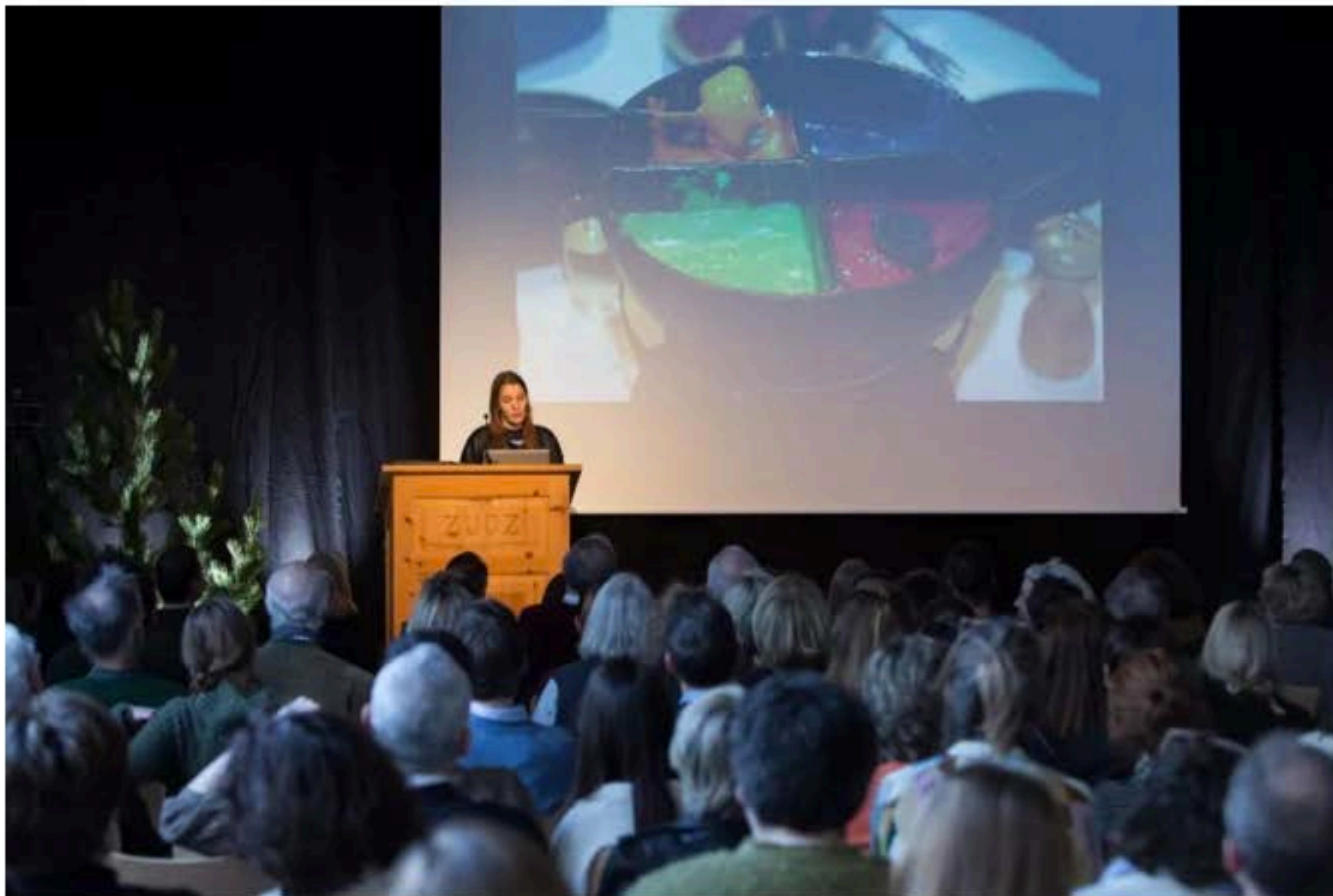
2018年“恩嘎丁艺术论坛”现场

一年一度的恩嘎丁艺术论坛（Engadin Art Talks，简称 E.A.T.）在位于恩嘎丁山谷内的小镇楚奥茨（Zuoz）举行。多名艺术家、建筑师、设计师、文学家以“乡村”为主题，展开了一次为期两天的深度讨论与对话。