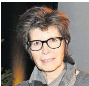
Elizabeth Diller, Star-Architektin aus New York.