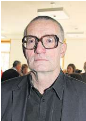
Der Künstler Thomas Hirschhorn.